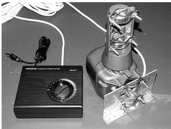
Antennrotor från Conrad elektronik

som de dyrare varianterna ger. Inomhusversionen 1530P har plastring i stället för aluminium. Det finns också en mindre inomhusloop på 70 cm att välja på.