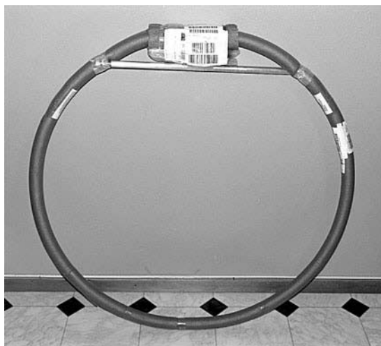
Loopen packad för transporten

Själv har jag inte så svår miljö, men en del störningar från mina datorer och från TV:n har jag som stör ut svaga stationer, t ex drunknade Radio St Helena i surr som gjorde den svår att uppfatta trots att den nog låg klart över det atmosfäriska bruset och mottagarens egenbrus. Alla sådana störningar är helt borta med ALA1530. Riktverkan är också mycket användbar, som exempel kan jag