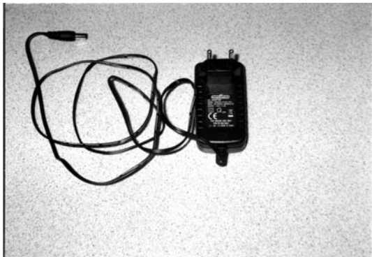
Bild på det störande Fabrimexaggregatet.

Nu hade vi identifierat storkällan, men inte åtgärdat den ännu. Fastighetsägaren sa att han skulle ordna den saken. Det felaktiga nätaggregatet blev ju varmt. Men