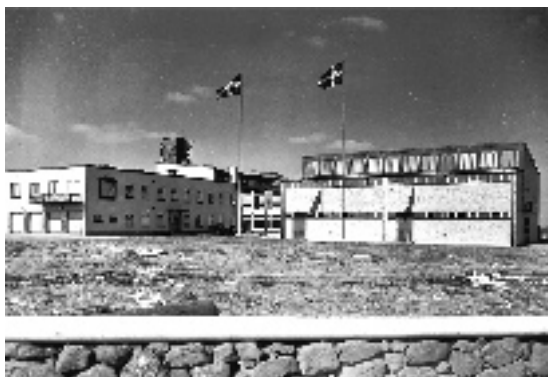
Sandarstationen i Hörby.

Sweden, SE-10510 Stockholm tel +4687848484, answering machine +46 8 7847238. Email radiosweden@sr.se samt WWW.sr.sr/rs.