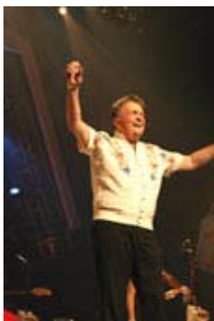
Kvällens show öppnades av Bill Anderson, som har haft hits under flera decennier.

noon Pressbox and The Sports Reporters. WNSR sänder även Nashville Predators' NHL-matcher. Programmen kan även avlyssnas via webben och adressen är www.wnsr.com