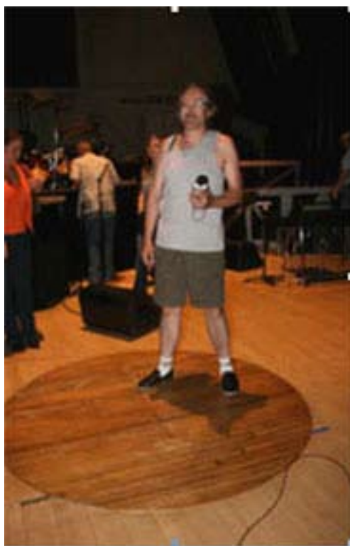
Den magiska cirkeln - en bit av golvet från den gamla Opryn på Ryman auditorium.