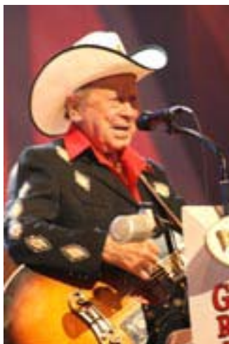
Oldtimern Little Jimmie Dickens har sjungit country sedan 1937 men är still going strong.