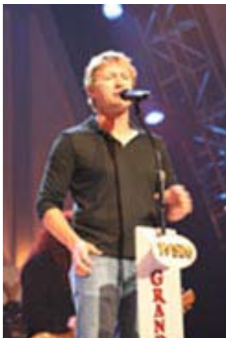
En av dagens country-hjältar Dierks Bentley - stor favorit hos de kvinnliga besökarna.