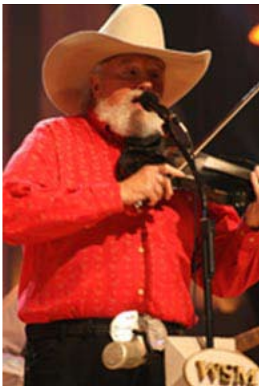
Charlie Daniels framför sin stora hit The Devil went down to Georgia .