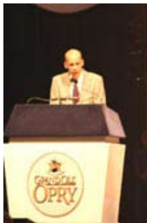
DJ Eddie Stubbs presenterar evenemanget live över WSM 650 från scenen.