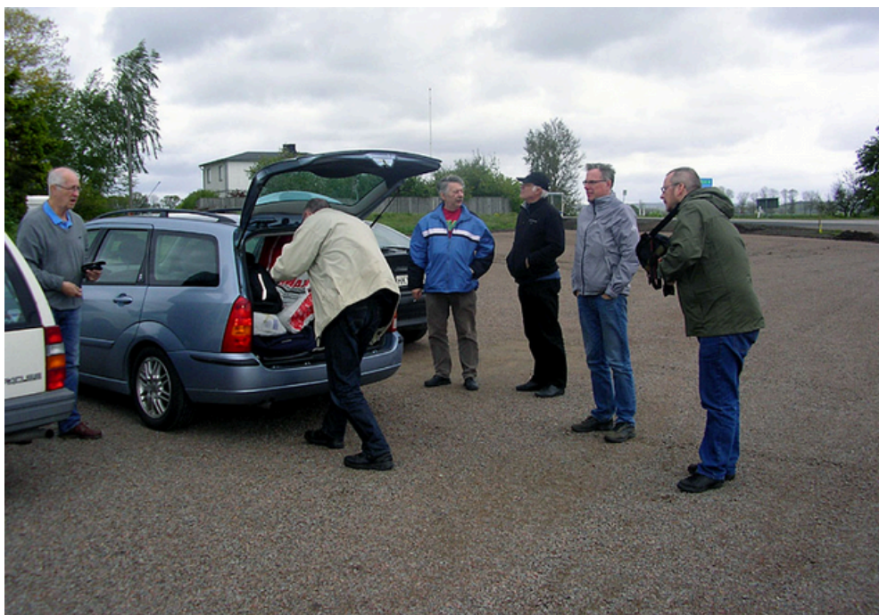
Parkeringen vid Grimeton