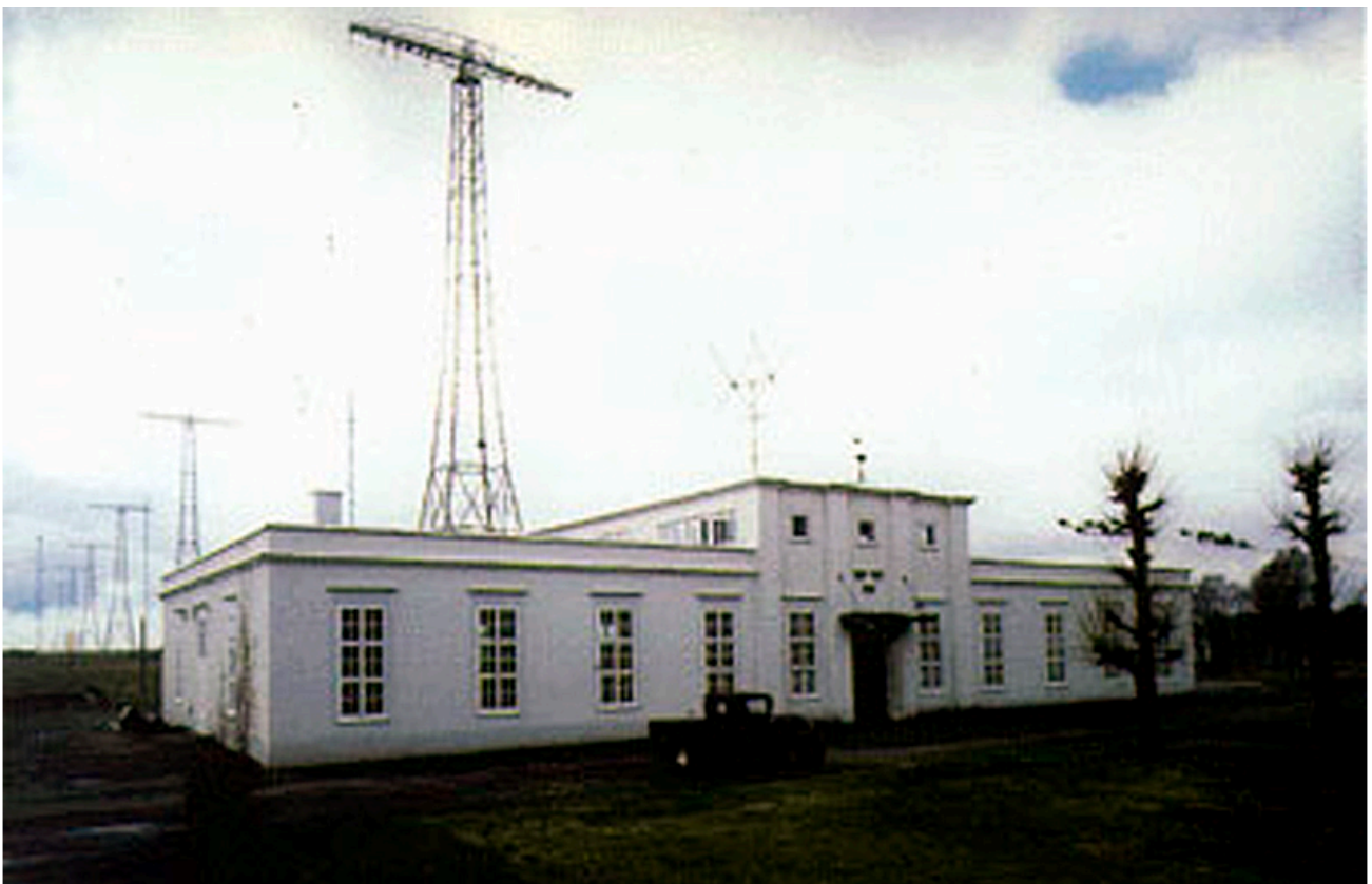
Gammal bild från dåtidens high tech