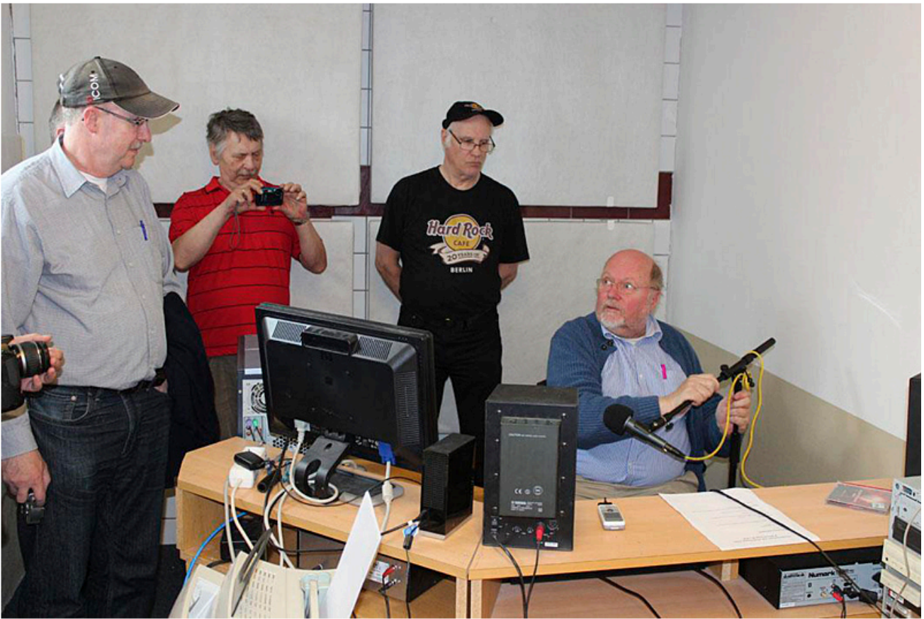
Radio Wake Up

kommer att plocka fram stationen med hjälp av QSL-listan.