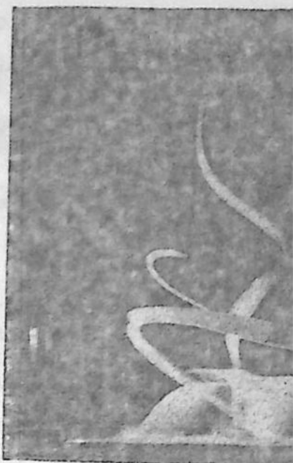
Norrköpings Museum med skulpturen "Spiral" av Atsuro Watabe

Arr: Vox Kortvägsklubb, Box 12062, Norrköping 12. Postgiro 68 28 14.