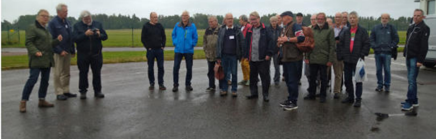
De flesta deltagarna utanför möteslokalen på Flygfältsvägen.